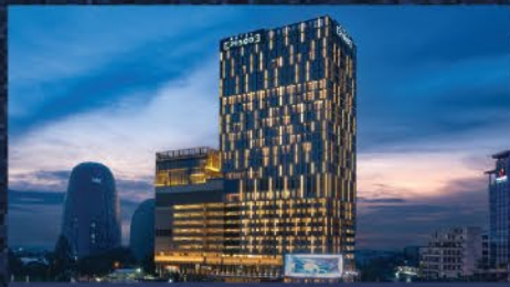
Hotels & Recreations