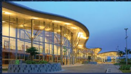
Business & M.I.C.E